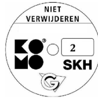
geschikt voor weerstandsklasse 2